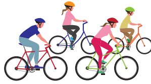
زيادة الصحة و برامج وخدمات الرفاهية