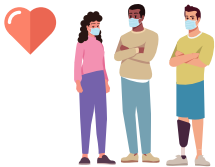
استمرار الجائحة دعم التعافي