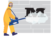
إزالة القمامة والكتابة على الجدران