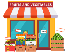
اقتصاد محلي مزدهر