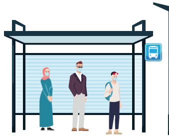
مواصلات نقل أفضل، إدارة حركة المرور، مواقف السيارات والأمان