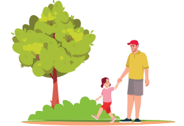
أجمل المساحات الخضراء