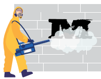
Απομάκρυνση σκουπιδιών και γκραφίτι

Ποιες ήταν οι ιδέες σας για το μέλλον του Moreland: