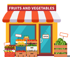
Μια ακμάζουσα τοπική οικονομία