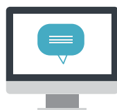
Συνομιλίες στο διαδίκτυο