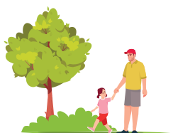
Πιο όμορφοι χώροι πρασίνου