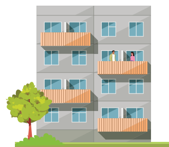
Sviluppo di progetti di qualità