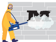
Rimozione di graffiti e spazzatura

Cosa avete immaginato per il futuro di Moreland: