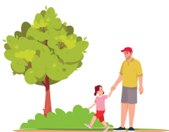
Più spazi verdi belli