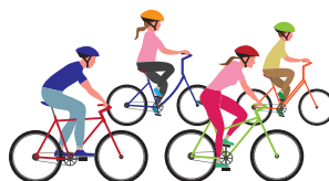
Incremento dei programmi e dei servizi per la salute e il benessere