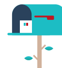
Spedizioni via posta