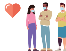
Proseguimento del supporto per la ripresa dalla pandemia