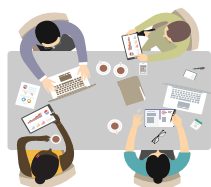
Gruppi di discussione