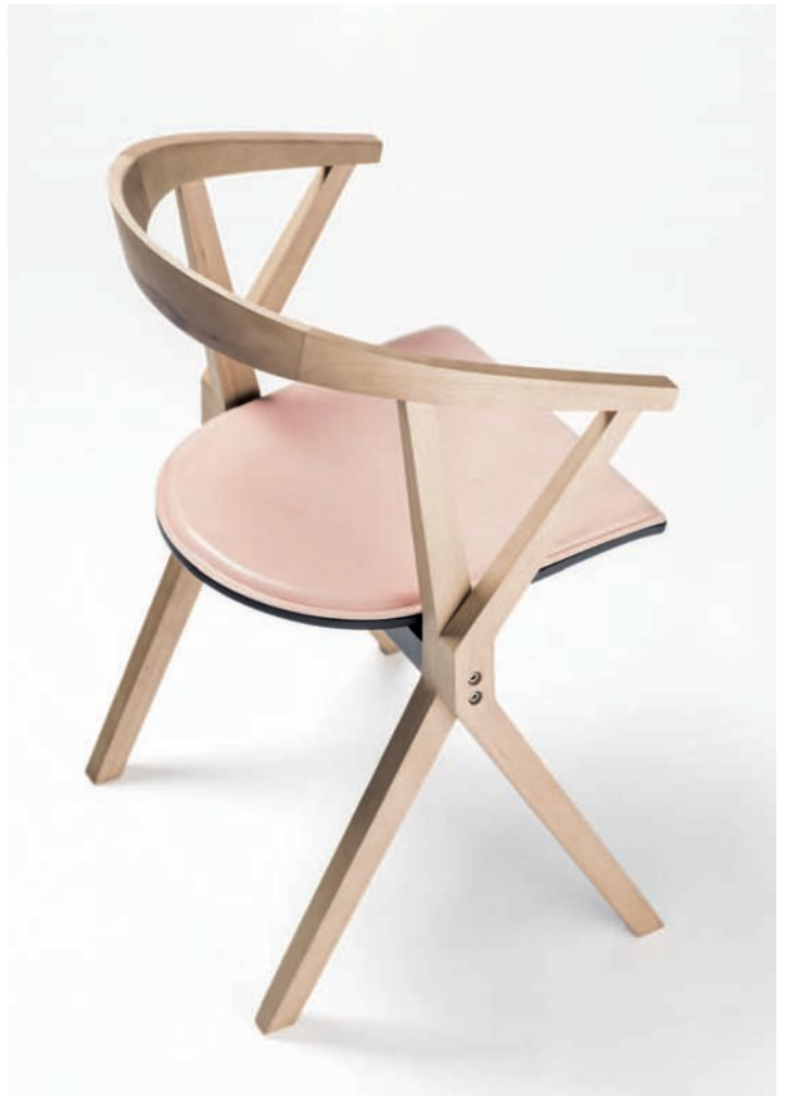
Due finiture di legno e versione con seduta rivestita in pelle.