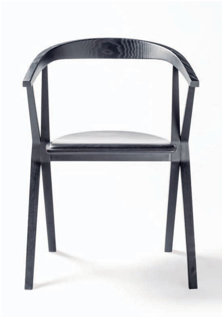
Dos acabados de madera y versión con asiento tapizado en piel.