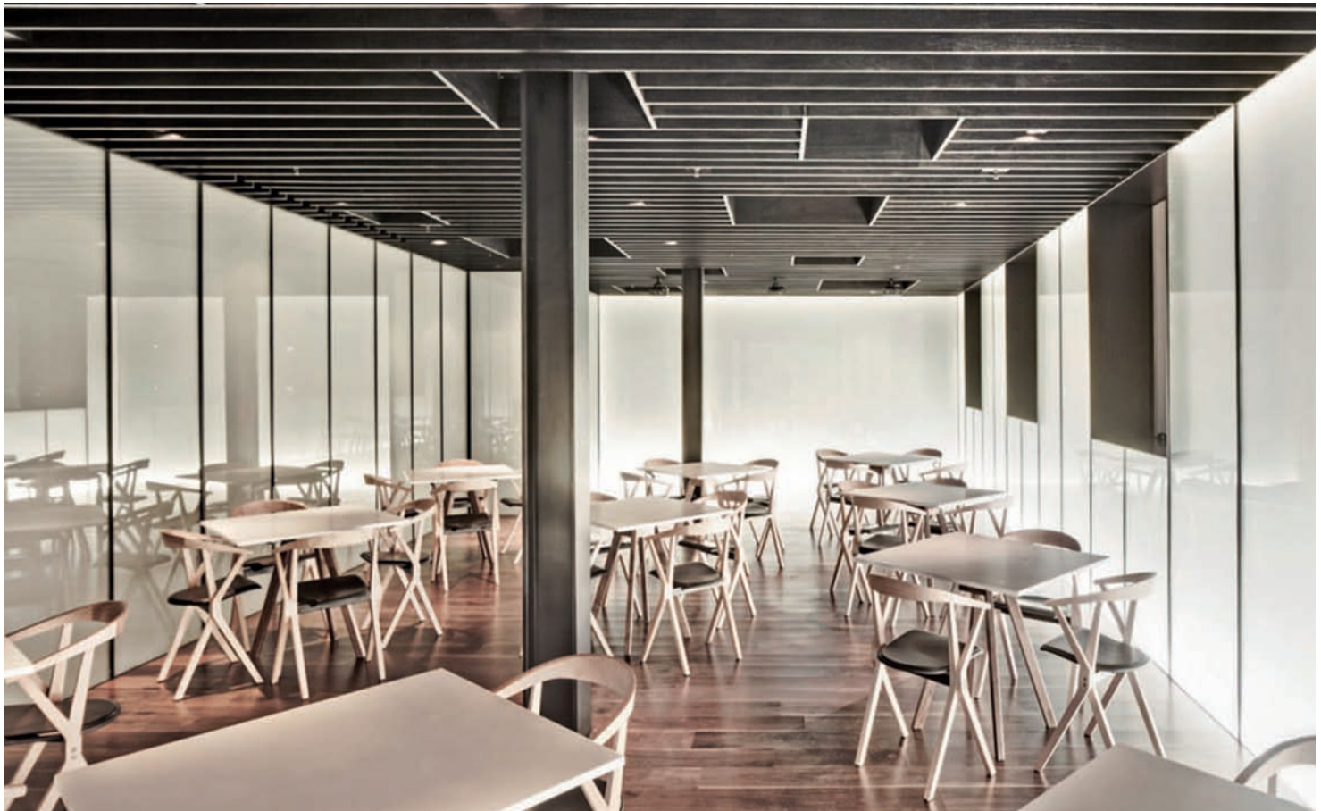
Unten, Restaurant New Heights in Shanghai, Projekt von Neri & Hu.