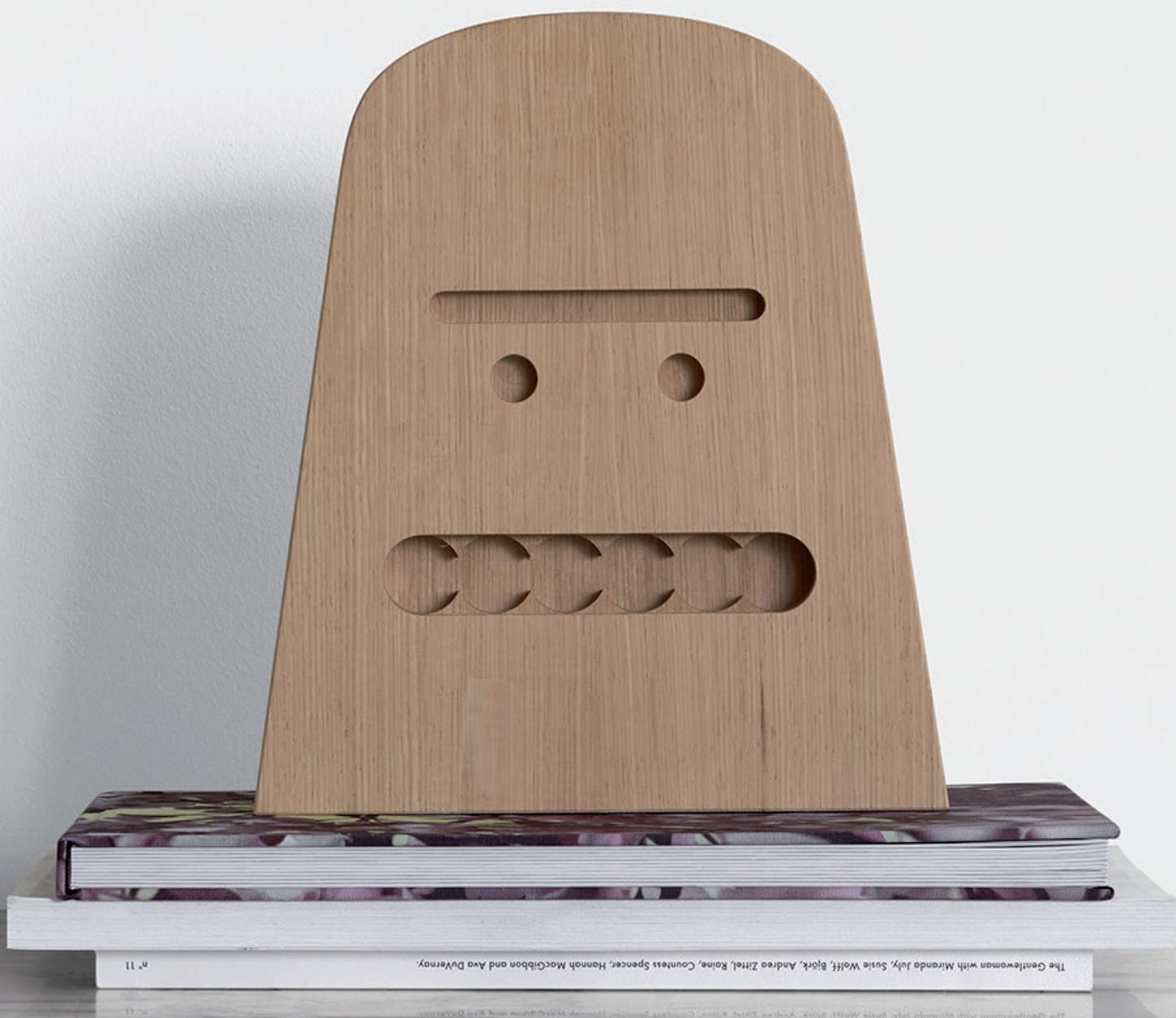
AC17 BIG B OBJEKT / OBJECT EICHE, UNBEHANDELT / OAK, UNTREATED