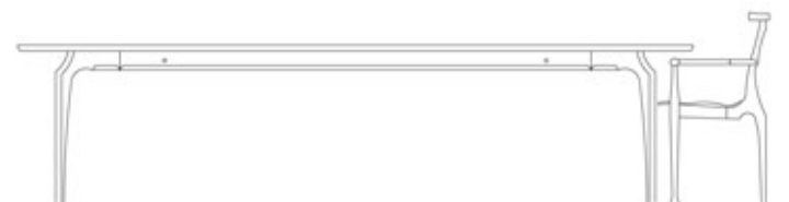
Mesa Gaulino. Gaulino table. Tavolo Gaulino. Tisch Gaulino.

Measurements in cm. Measurements in inches.